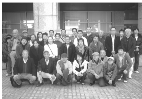
視察先での記念撮影

建設業部会では、3月14日(日)に31名の参加者で日帰り視察研修を実施いたしました。視察先は横浜の三菱みなとみらい技術館。宇宙、海洋、交通・輸送、くらしの発見、環境・エネルギー、技術探検の6つのゾーンに分かれており最先端の技術に触れることができました。研修終了後は大江戸温泉で懇親を深めました。