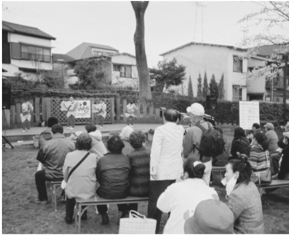
さくらまつりのステージ

にぎやかに開催された さくらまつり 4月4日に三鷹市の農業公園で「さくらまつり」が開催されました。当日は肌寒いを通り越して冬のような寒さでしたが、満開の桜の中、多くの方が集まりました。中央のステージでの催し物や各商店会が出店する暖かい食べ物などを楽しんでもらうなど、市民との交流が深められた一日でした。(委員・出田)