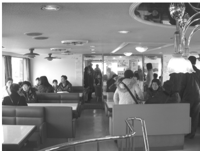
クルージングを楽しむ

2月21日に商工会恒例行事である「日帰りバスツアー」を実施いたしました。 総勢178名の方に参加をいただいた。バスは一路駿河路へ……。静岡岡原清水のすし横町やクルージング、そして最後は実ったばかりのおいしい苺を掴み取りいただきました。お腹がいっぱいのツアーでした。