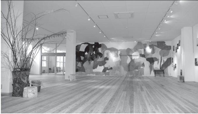
あきゅらいず美養品「森の楽校ホール」