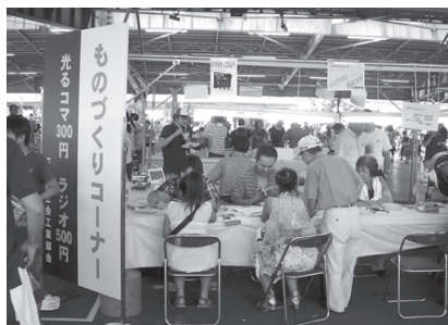
昨年の「みたか商工まつり」。「ものづくり体験コーナー」のラジオ・光るコマ制作のコーナー。商工会工業部会の会員が指導。今年も出展します。