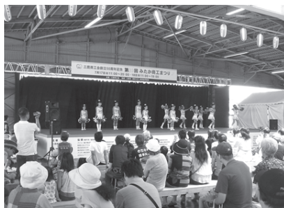
昨年、ステージでパフォーマンスを披露してくれた体操教室『TACファルコンズ』のチアダンスチーム。今年も参加します。