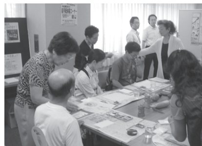
昨年の「匠の技」実演・展示コーナーには様々な催しが。今年も多くの組合・団体が出展します。

三鷹商工会の力と技が集結! いつものお楽しみに加えて 今年はチャリティーも 年に一度の「みたか商工まつり」の季節が今年もやってきます。会員同士がつながる機会として、また市民の方々の交流の場として開催されるイベントです。会場が大屋根広場(東京多摩青果株跡地)になって4回目になります。 今年、3月11日の東日本大震災を受けて、三鷹市の姉妹都市である福島県矢吹町の復興支援のための物産販売も行います。女性部は「チャリティーバザー」も開催します。ので、みなさんもお力添えください。矢吹町に絵手紙を送る郵便局のコーナーも設置されます。被災地支援のための義援金も募りますので、ご協力をお願いします。 そして子どもたちが心待ちにしているキャラクターショーに今年登場するのは「海賊戦隊ゴーカイジャー」と「ちびまる子ちゃん」。 また、例年たくさんの方々にお楽しみいただいている「ものづくり体験コーナー」では、木工教室、ラジオ、光るコマ、タイルdeアートなど、時間を忘れて没頭してしまいたいような様々な「ものづくり」が目白押しです。 そのほか、ゲームコーナーや模擬店、物販をはじめ、「三鷹の産業コーナー」、「商工業者・組合・団体等のPRコーナー」、「JA東京むさし農産物販売」、「匠の技実演・展示」など、地域の産業を担う人々や技との出会いの場にも、例年通り充実した出展が揃います。 いろいろな視点で楽しめる「みたか商工まつり」は2日にわたっての開催です。ご家族やご友人とお誘い合わせて、ぜひいらしてください!