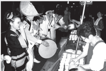
商工会女性部の総勢20名は、踊り手の皆様に水などを配布しました