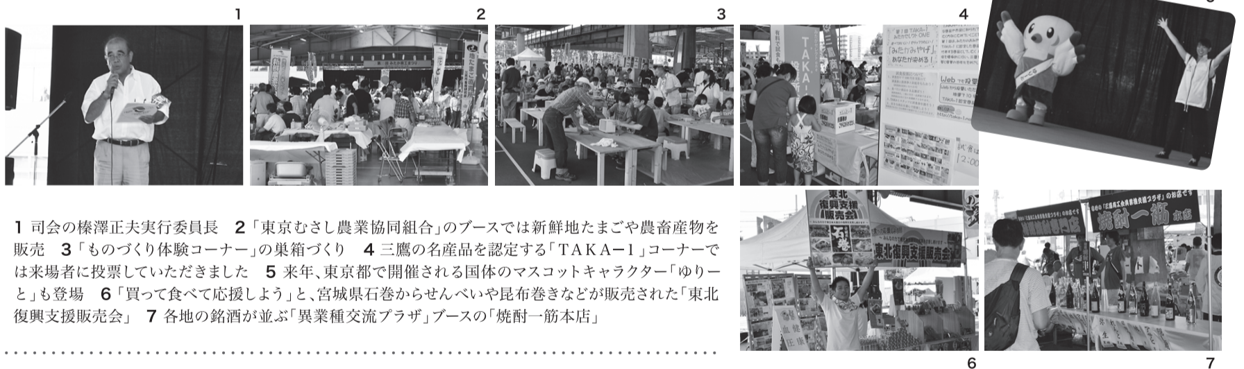
1 司会の榛澤正夫実行委員長 2 「東京むさし農業協同組合」のブースでは新鮮地たまごや農畜産物を販売 3 「ものづくり体験コーナー」の巣箱づくり 4 三鷹の名産品を認定する「TAKA-1」コーナーでは来場者に投票していただきました 5 来年、東京都で開催される国体のマスコットキャラクター「ゆりーと」も登場 6 「買って食べて応援しよう」と、宮城県石巻からせんべいや昆布巻きなどが販売された「東北復興支援販売会」 7 各地の銘酒が並ぶ「異業種交流プラザ」ブースの「焼酎一筋本店」

夏の日差しが一段と厳しい7月14日(土)・15日(日)の2日間、「第35回みたか商工まつり」が今年も開催されました。三鷹市役所隣の大屋根広場(三鷹市暫定管理地)を会場に、ジブリ美術館コーナー、三鷹の産業コーナーなど80団体・企業が物産品販売や実演・展示を行い、夕刻からはムーちゃん音頭や阿波踊り教室、チャリティ