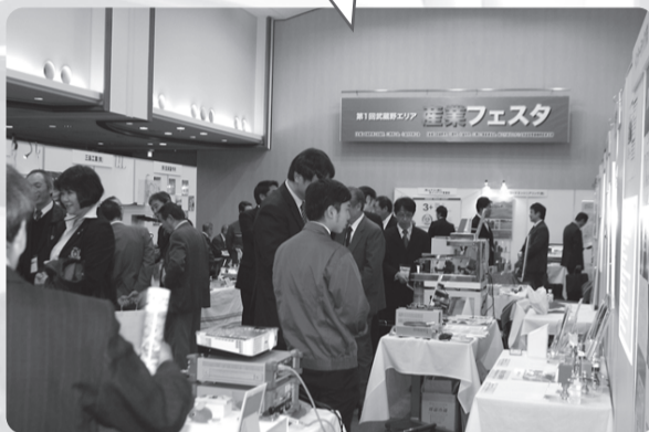
産業プラザ7階全フロアに各ブースを設置

A:円高・デフレ不況な技術力を持ちながらする中小企業に、ピが目的です。ひいて化につながるが