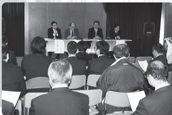
パネルディスカッションも開催 (写真はすべて昨年度のものです)