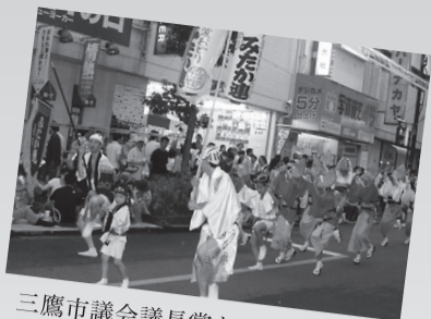
三鷹市議会議長賞を受賞した「みたか連」