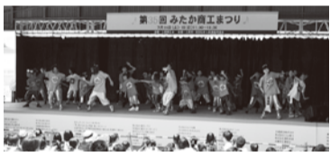
今年は三鷹市役所で開催します!お楽しみに!(写真は今年のステージの様子)

今年の「みたか商工まつり」は、7月13日(土)・14日(日)の2日間、三鷹市役所で開催されます。昨年までは大屋根広場(三鷹市暫定管理地)でしたが、会場が変わりましたのでご注意ください。 キャラクターショーやバンド演奏・ダンス等の特設ステージ、お楽しみ抽選会、ものづくり体験、FC東京コーナー、ジブリ美術館コーナー、各種ゲームコーナー、模擬店や物販、匠の技・実演・展示チャリティ バザーなど、楽しい催しがいっぱいあります! ご家族、お友達とお誘い合わせのうえ、ぜひご来場ください。