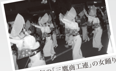
昨年の「三鷹商工連」の女踊り

三鷹商工連 「第46回 三鷹阿波おどり」 その2【踊り編】 踊る阿呆に見る阿呆、 同じ阿呆なら踊らにや損ね!