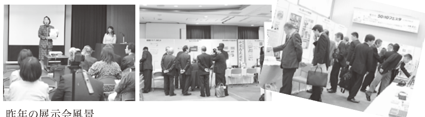
昨年の展示会風景

開催日時：平成25年 11月6日(水) 12:00~17:00 (その後懇親会あり) 会場：三鷹産業プラザ7階 入場料：無料 主催：第16回 SOHOフェスタ実行委員会、三鷹市、三鷹商工会、株式会社三鷹 出展料：SOHO 5,000円/企業 10,000円 (出展募集中10月7日まで) 問い合わせ先：TEL:0422-40-9669/フェスタ担当