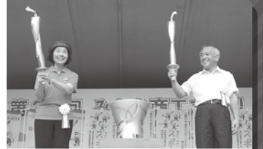
「スポーツ祭東京2013」に向けての 炬火採火イベント