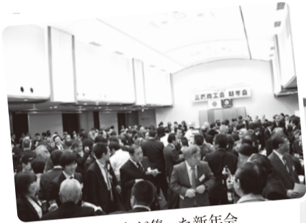
280人が集った新年会