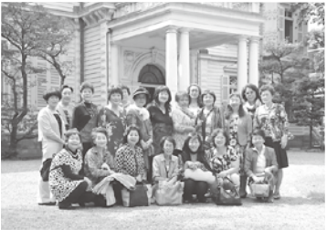
重要文化財『旧岩崎邸庭園』にて

*9/19 日帰り視察研修会* 秋晴れの中、参加者22名で出発。はじめに岩崎邸庭園を見学。その後隅田川を水上バスで移動。銀座でお寿司を堪能し、研修会場の(株)TASAKI 紀尾井町店へと向かう。ジュエリーセミナーでは真珠やダイヤモンドの講義があり、ジュエリーのコーディネートも実践を交えて教えていただきました。日常を離れ、素敵な邸宅や風景、ジュエリーを拝見でき、心満たされる一日となりました。