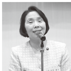
清原三鷹市長の祝辞

総代会・部会総会に続き午後6時15分より、三鷹産業プラザにて合同懇親会が開かれました。任期満了に伴う新役員35人が壇上で紹介され、200人が親睦を深めました。4期目の市長を務める清原市長からは、「三鷹市のコミュニティ創生と活力あるまちづくりを進めるために共に手を携えてまいります」との祝辞をいただきました。