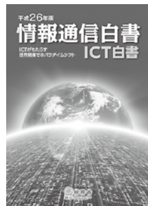
※1:総務省 平成26年版情報通信白書 平成25年調査

ご家族や仕事仲間に勧められて長年親しんでいたガラケーからスマホに買い換えた方も多いたと思いますが、いざ買ってはみたものの「何が違うんだろう」と素朴な疑問を捨てきれず、慣れない手つきでタップ、フリック…と操作してみても全然面白くないということも…。