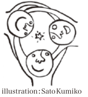
illustration: Sato Kumiko