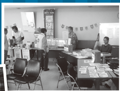
◀三鷹のカルタ 「みたカルタ」で勝負だ!