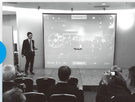
出展企業によるデモンストレーション