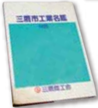
【写真12】1983 (昭和58) 年3月 「三鷹市工業名鑑」発行