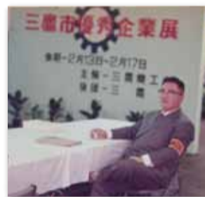
【写真08】1971 (昭和46) 年2月 大手町の都立産業会館で三鷹市優秀企業展開催