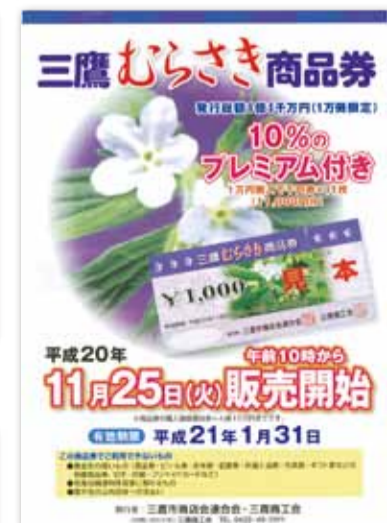
【写真22】2008 (平成20) 年11月 「三鷹むらさき商品券」発行