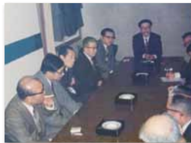
【写真02】1962 (昭和37) 年6月 「技術セミナー」開始