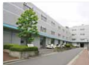
【写真13】1989 (平成元年) 年4月 「三鷹ハイテクセンター」完成