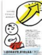
【写真20】2007 (平成19) 年11月 現在の「三鷹実践経営塾」開講