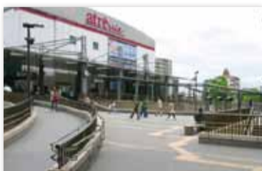
【写真19】2006 (平成18) 年3月 三鷹駅南口ペDESTリアンテックが完成