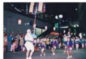
【写真14】1996 (平成8) 年8月 三鷹商工会が「商工連」を結成し「三鷹阿波踊り」に初参加