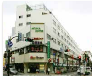
【写真04】1963 (昭和38) 年9月 「三鷹センター」開店 (写真は現在の姿)