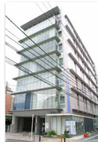
【写真15】2000 (平成12) 年4月 「三鷹産業プラザ」完成