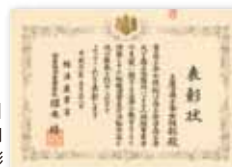
【写真23】2009 (平成21) 年5月 女性部に関東経済産業局長表彰