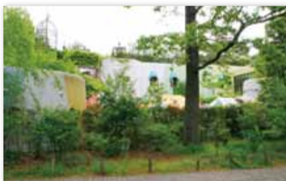
【写真16】2001 (平成13) 年10月 「三鷹の森ジブリ美術館」オープン