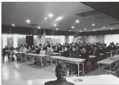
【写真01】1961 (昭和36) 年10月 優良従業員表彰開始