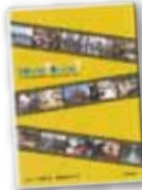
【写真18】2005 (平成17) 年11月 異業種交流プラザ20周年記念DVD制作