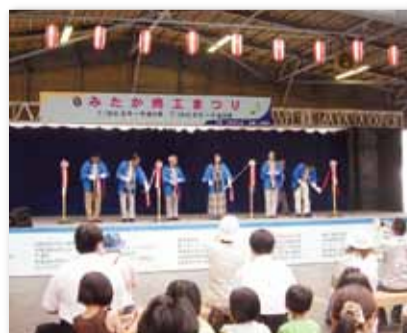
【写真21】2008 (平成20) 年7月 「みたか商工まつり」大屋根広場で開催