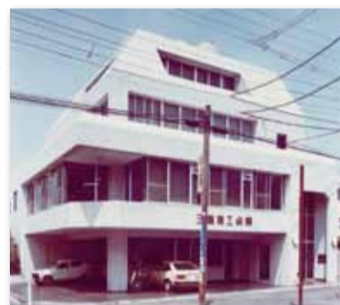
【写真10】1978 (昭和53) 年3月 三鷹商工会館完成