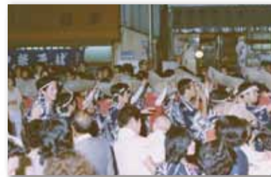
【写真05】1968 (昭和43) 年8月 「三鷹阿波踊り」開催 (写真は1977年)