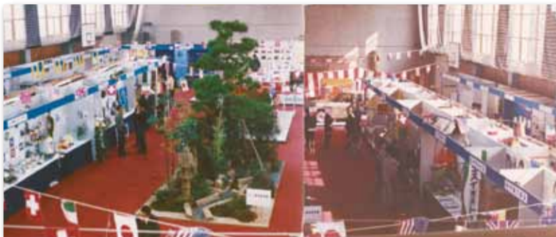
【写真03】1962 (昭和37) 年11月 三鷹一中の体育館で「三鷹商工展示会」を開催