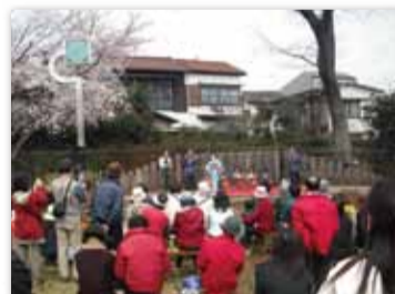
【写真17】2002 (平成14) 年4月 「みたかさくらまつり」開催