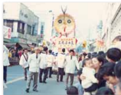
【写真07】1970 (昭和45) 年11月 創立10周年記念パレード