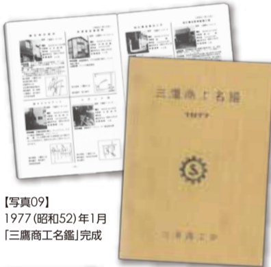
【写真09】1977 (昭和52) 年1月 「三鷹商工名鑑」完成