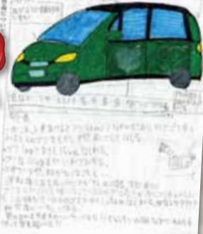
▶入賞したみなさん