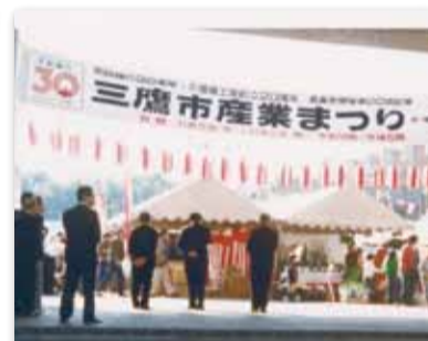
【写真11】1980 (昭和55) 年11月 「三鷹市産業まつり」開催