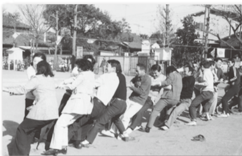
【写真06】1969 (昭和44) 年10月 工業部会運動会開催